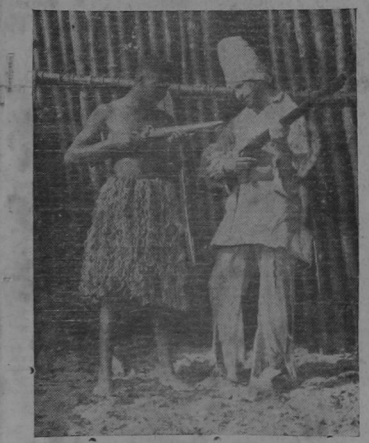
Martes pronto aprendió a tirar con el físal. La empolizada de bambú que se ve atrás era al costado de las cabras

Una importante noticia acerca de arroz, que ayer tuvo en relación con la producción del arroz, que como se sabe, es uno de los artículos de primera necesidad de mayor consumo. A raíz de la llegada de los diez mil quintales pedidos por el gobierno a Alemania, el precio de este artículo se permitieron como era natural una sensible baja. Pocos días después de llegada, esta partida, empezó a recular, a aumentar fuertemente, por esta razón es que tiene que irse recalcando poco a poco. Pero en su forma se ha podido hacer un buen negocio, que como decimos, llegará la semana entrante. El precio medio en esta semana ha sido de veinte colones, pero se nos informa que con esta cantidad se puede comprar que hasta, llegando a unos dieciocho colones el quintal. Apenas llegue la cantidad a Puntarenas, será trasladada a esta capital para ser comprada. Ayer tuve que ser informado por el presidente Jimétez a esta capi-