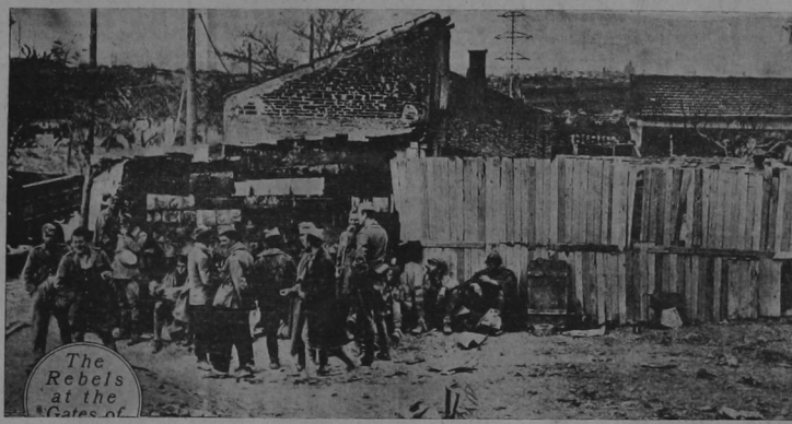
Fuerzas nacionalistas descansando después de sus largas marchas forzadas y rudos combates a una milla de Madrid. Nótese a lo lejos los altos edificios de la capital que aparecen en el centro de la foto

Rusia ha enviado a estas horas no menos de 197 barcos a los puertos españoles totalmente cargados de víveres o de elementos de guerra. El gobierno ruso cuando se le ha echado en cara esta flagrante violación de la neutralidad que está obligado a las demás naciones ha contestado que esta ayuda no la envía el gobierno sino que es por iniciativa propia de los obreros rusos y sus hermanos los obreros españoles, que combates particulares se han organizado en estos puertos. Para a la página TRECE