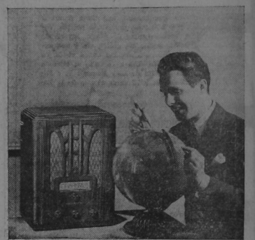
MODELO E-71 Caja de estilo neoclásico de nogal americano...