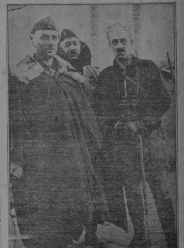
El coronel Tella, héroe de la batalla del puente de Toledo, que fue herido cuando los gobiernistas volaron parte de este antes de retirarse. La foto muestra al bizarro militar en compañía de algunos de los oficiales de su estado mayor con los que confirió al regresar al frente de Madrid.