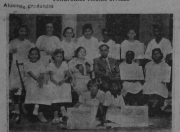
Alumnas graduadas. Ofrecemos a nuestros lectores una fotografía de las alumnas...