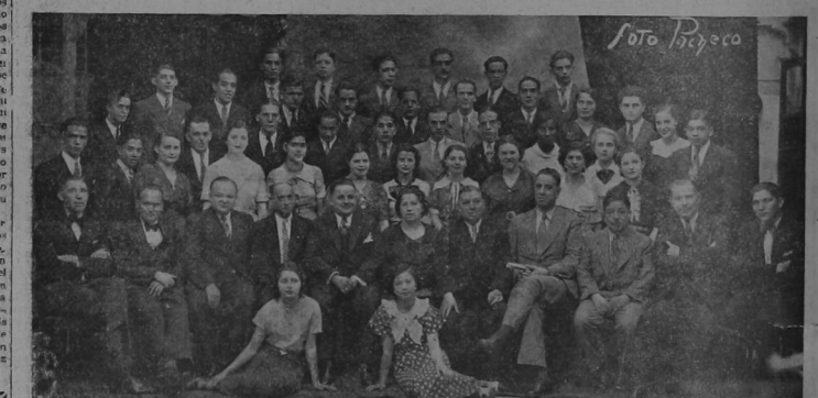
PROFESORADO DE LA ESCUELA Y GRADUADOS DE 1936

LECTIVO LA ESCUELA DE COMERCIO "MANUEL ARAGON" A LAS 7 30 p. m. TENDRA LUGAR EN EL TEATRO NACIONAL LA FIESTA DE CLAUSURA